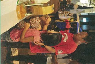
新鮮な馬刺しとこだわりの旨酒味わえる馬肉専門店。

路地裏の蕎麦割烹店主自らが付けるこだわりの酒と肴もこちらの手打ち蕎麦は絶品 ☎03-3256-5566 (定休日) 土日祝