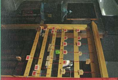
和食職人が作るおいしい酒香や料理

路地裏にある、東京オーブンの2号店になりました。 ☎03-6206-0789 (定休日) 土日祝